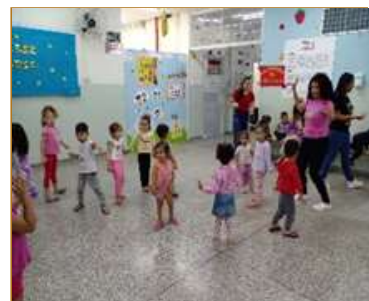
Festa da música