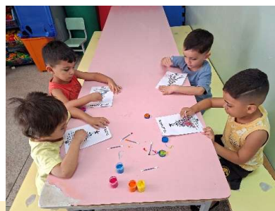
Confecção da árvore de natal