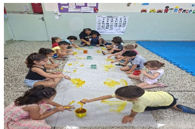
Pintura livre – Expressando artisticamente.