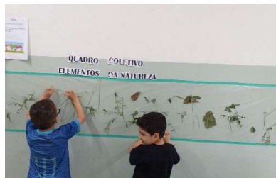
Explorando elementos naturais