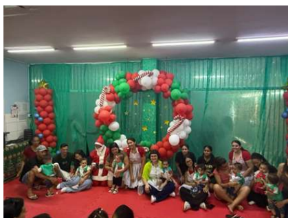
Festa de Natal – Apresentação para as famílias.