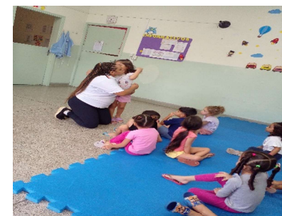
Karaokê para turma