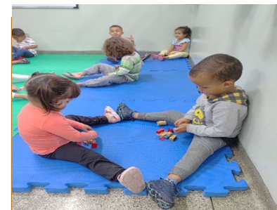
Monta- monta com ajuda do amigo

Sede: ALAMEDA DA CRIANÇA, 105 VILA VITÓRIA – (19) 3875-4598