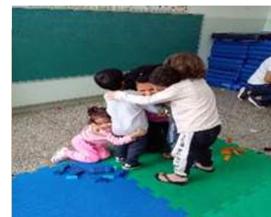
Despedida dos Amigos