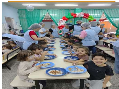
Almoço de Natal -Confraternização entre as turmas