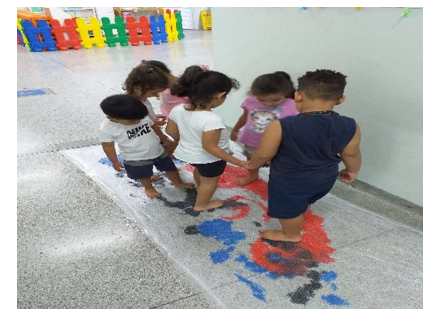
Pintura com os pés

Sede: ALAMEDA DA CRIANÇA, 105 VILA VITÓRIA – (19) 3875-4598