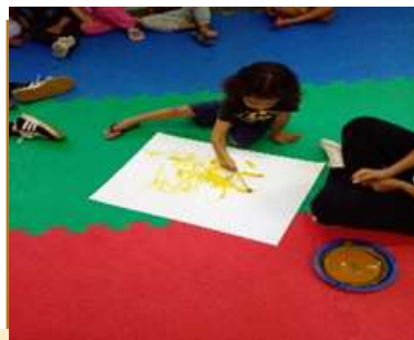
Pintura com açafrão – explorando elementos naturais.