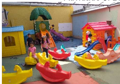
Brincadeiras no Parque