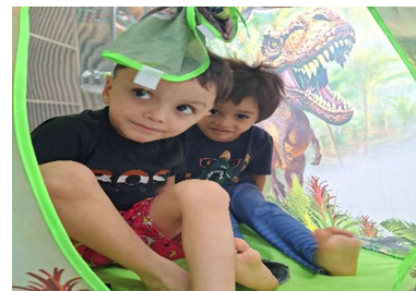
Brincando com barracas