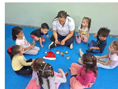
Caça tesouro de natal