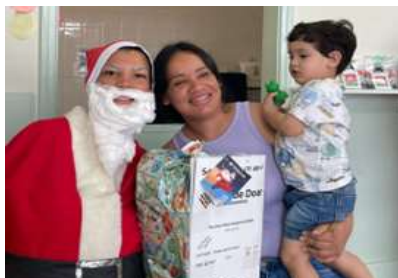
Visita do Papai Noel