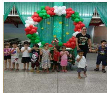
Aniversariantes do mês de Dezembro