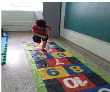
Brincando de Amarelinha