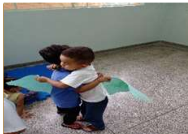
Trocas de cartão de Natal