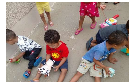
Brinquedos livre escolhas

Sede: – ALAMEDA DA CRINÇA, 105 – VILA VITÓRIA (19) 3875-4598