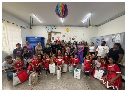
Conhecendo a família do amigo