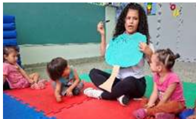
Árvore dos desejos – As Famílias desejaram uma mensagens aos seus filhos.