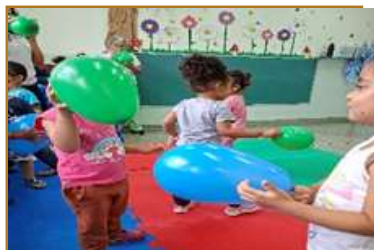
Cantinho das bexigas – Explorando e participando de brincadeiras com bexigas.