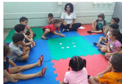
Roda de conversa dos sentimentos